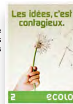
Affiche électorale pour les élections communales