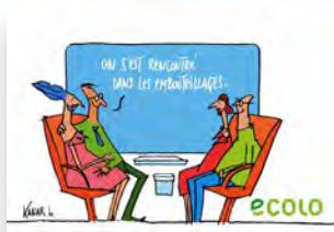
Carte postale Saint-Valentrain. III. Kanar