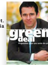
Livre de J.-M. Nollet. Ed. Le Cri et Etopia