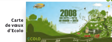
Carte de vœux d'Ecolo