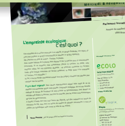
Colloque sur l'empreinte écologique par le groupe parlementaire bruxellois et Étopia