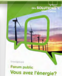
Invitation à un forum Des solutions pour chacun, détournant un slogan d'Electrabel