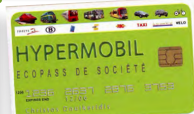
Carte Hypermobil, écopass de société