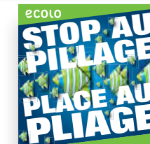
Tract de l'action «Poisson d'avril» dénonçant la surpêche