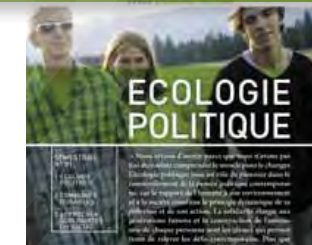
1ère revue Étopia