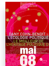
Conférence sur l'écologie politique comme héritage de mai 68 avec Dany Cohn-Bendit (Etopia)