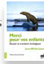
Livre de JM. Javaux. Ed. L. Pire