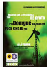
Affiche de la fête de Kyoto