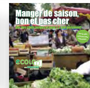
Livre de recettes pour promouvoir l'alimentation durable (Ecolo)