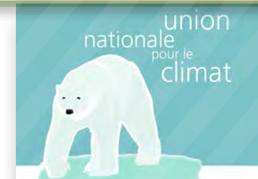
Proposition d'Ecolo d'une Union nationale pour le climat