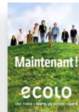
Affiche électorale pour les élections fédérales